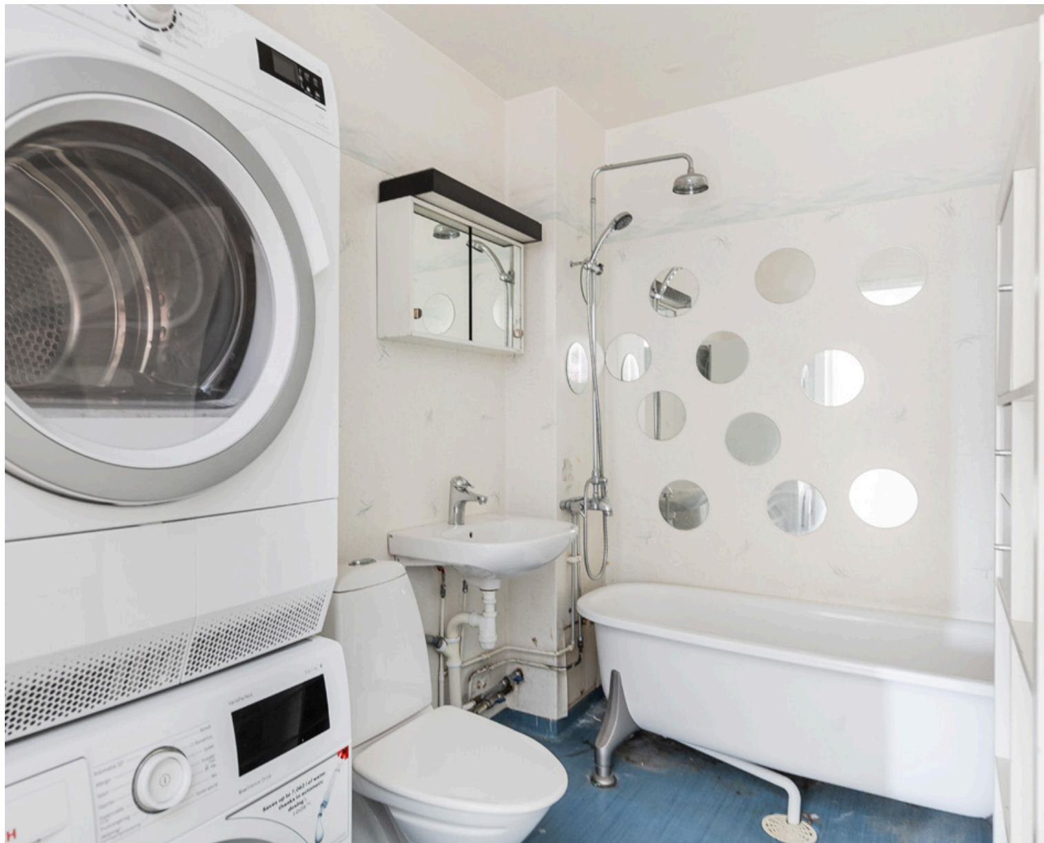
En gäst-WC samt ett stort badrum utrustat med badkar, toalett, handfat, spegelskåp, tvättmaskin och torktumlare.